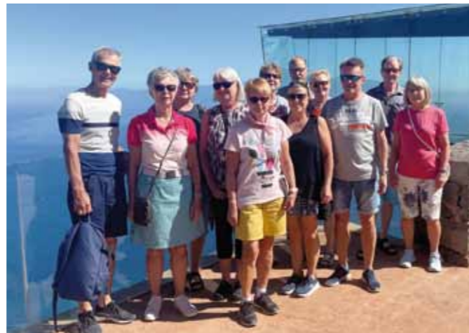
■ Kaikki ei ole pelkkää golfia, vaan yhtenä päivänä osa ryhmästä teki ikimuistoisen retken tutustuen saaren nähtävyyksiin.

Osa porukasta teki retken La Gomeran erikoisiin maisemiin. La Gomera on rauhallinen Kanarian saari. Sen todella monipuolinen luonto ja saaren kaksi ihan erilaista maisemaa ovat näke-