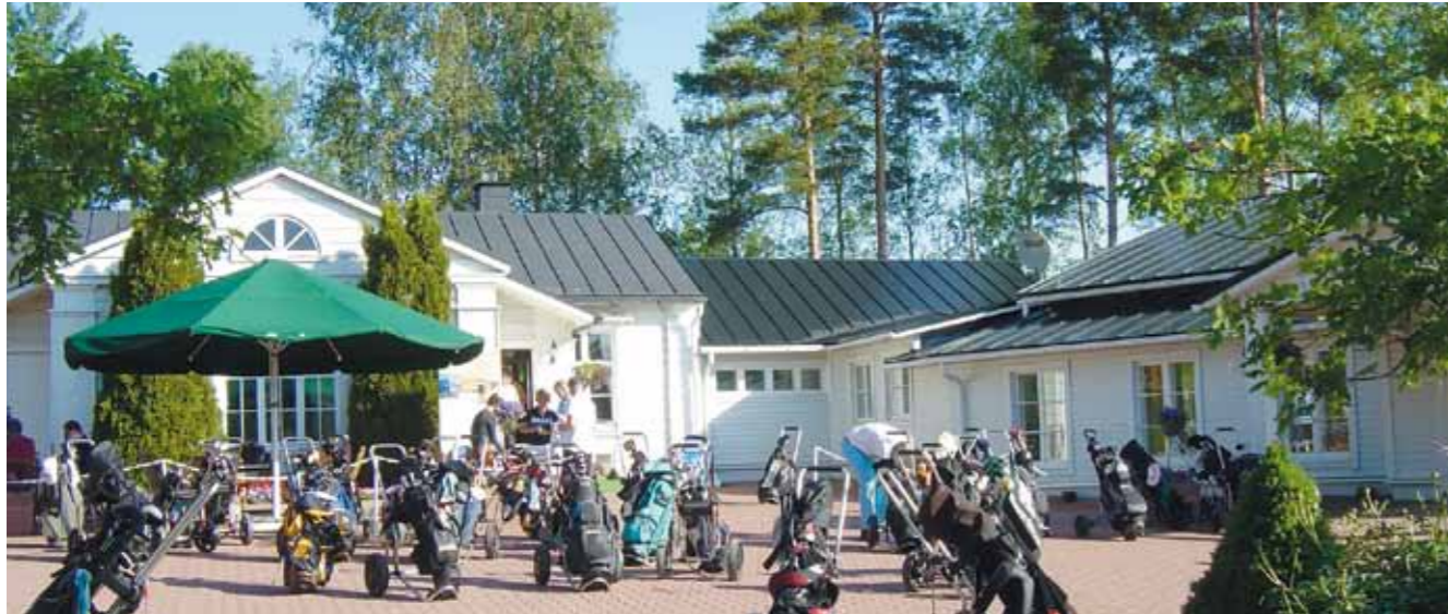
SGS-pelioikeuksia käytettiin viime kautena toiseksi eniten Espoon Golfseurassa (kuva) eli noin 650. Viikkainta käyttö oli Kultarannassa, missä pelaajamääriä ei rajoitettu.