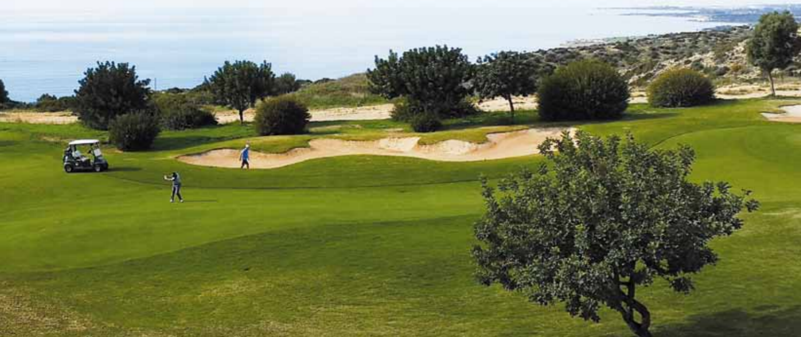
■ Näkymä hotellin parvekkeelta Aphrodite Hillsin ysisiväylälle.

Kotikenttämme Aphrodite Hills sijoittui kukkuloille syvien rotkojen reunoille. Varsinkin väylä 7 (par 3) oli jo tiipaikalle pääsyn osalta jännittävä. Mutkikas laskeutuminen golfautolla suoritettiin varovasti kieli keskellä suuta. Secret Valley näkyi Aphroditen kukkuloille eli ”linnuntietä” olivat ihan vierekkäin.