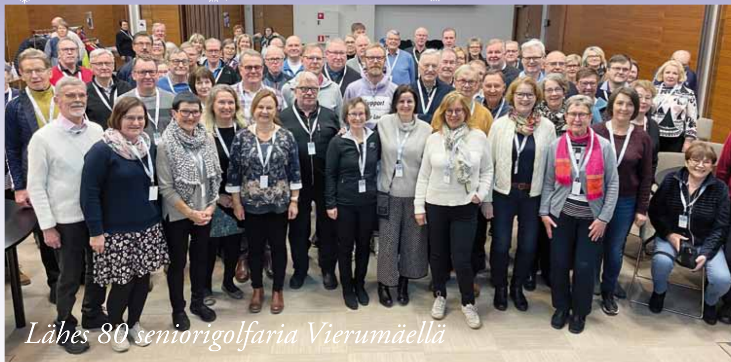
Lähes 80 seniorigolfaria Vierumäellä