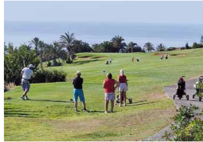
■ Tästä se lähtee. Tecina Golfin ykkösväylä on korkeimmalla kohdalla ja siitä lähdetään menemään vuorenrinnettä alaspäin.

La Gomeralla on yksi golfkenttä, Tecina Golf. Sen maisemat ja profiili tarjosivat upean kokemuksen. Väylät ovat vaihtelevia, vaikeita, mutta muutaman kierroksen jälkeen niihin sai jo jon-