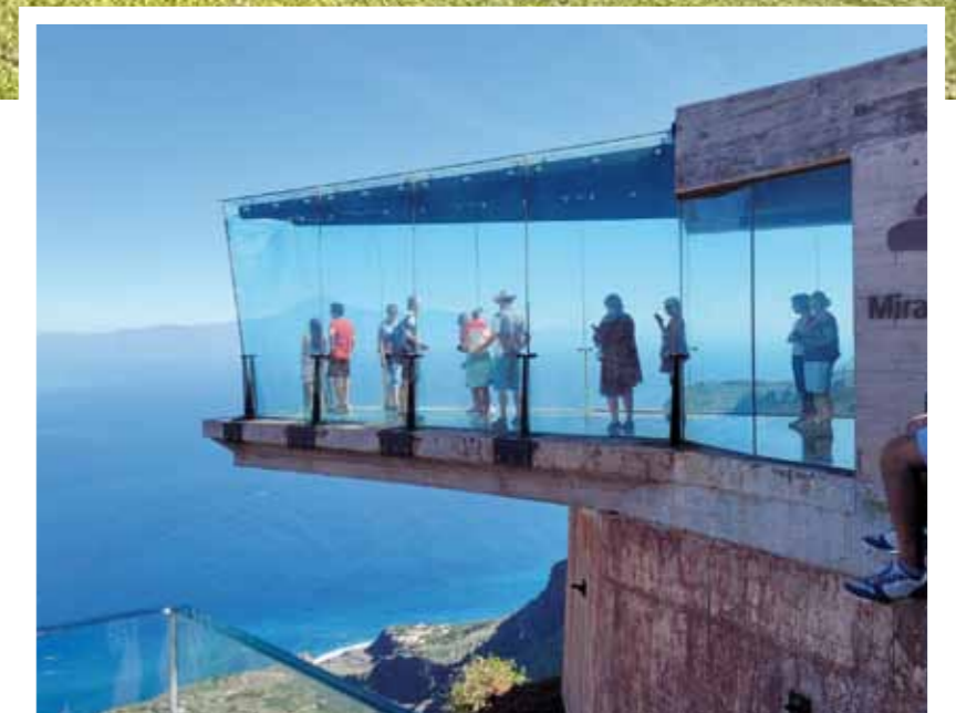
■ Saariretken mieleenpainuvuin näkymä avautui Agulon kylän yläpuolella olevasta Mirador de Abrante lasiterassilta.

Hotellimme Jardin Tecina on kuin pieni kanarialainen kylä. Huoneet ovat matalissa rivitalomaisissa muodostelmissa pitkin kaunista vuoren rinnettä jyrkän kallioseinämän päällä. Rappuja ja käytäviä riittää