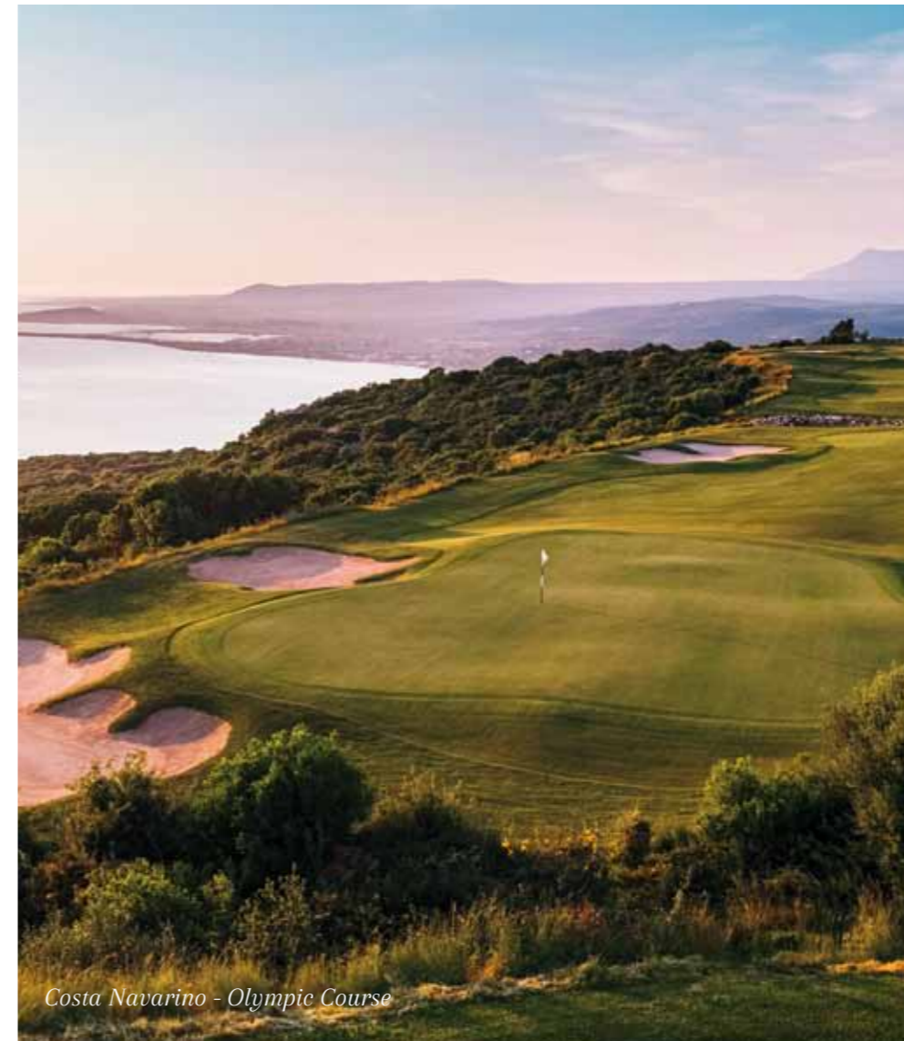
Costa Navarino - Olympic Course