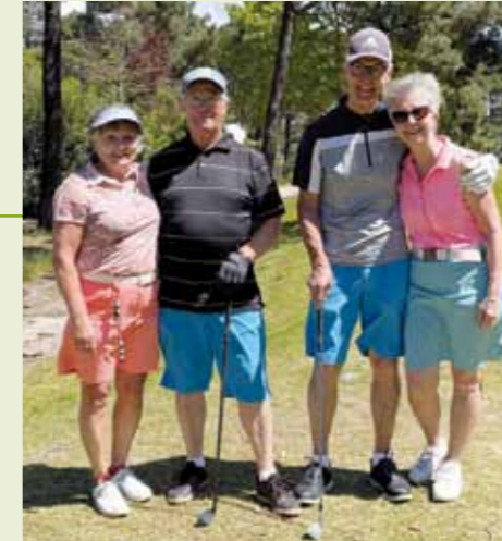
■ Hyyppät Kokkolasta ja Kaukua Järvenpäästä tapasivat ensimmäisen kerran SGS:n matkalla Tunisian El Kantouiin vuonna 2018 ja nyt uudestaan Aroeirassa.

Keväällä 2022 olimme Portugalin Aroeirassa. Olimme kuulleet Portugalista golfkohteena paljon hyvää. Matkaesitteestä muodostui kuva tasokkaasta golfmatkasta. Lentokentältä oli lyhyt siirtymä kohteeseen. Myös Lissabonin retki kiinnosti. Junayhteydet kotoamme Pohjanmaalta sopivat hyvin yhteen lentoaikojen kanssa. Varasimme matkan tietyn odotuksin.