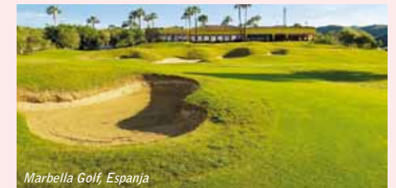
Marbella Golf, Espanja

Espanjan Aurinkorannikolla mm. Calanova Golf, Lauro Golf, Mijas Golf, Marbella Golf, Miraflores Golf ja Santana Golf sekä Alboran Golf Andaluusian Almeriassa tarjoavat golfsenioreille edullisia pelimahdollisuuksia. Näin tekevät Virossa myös Niitvälja Golf ja Otepää Golf , Ozo Golf, Latviassa ja Sand Valley Golf Puolassa.