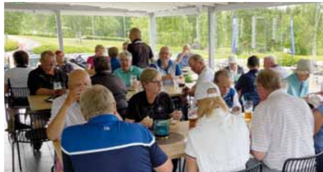
■ Nurmijärvellä ajoitus oli täydellinen. Peli sujui auringonpaisteesta ja vasta kokoporukan päästyä klubille katon alle alkoi Pekka Poudan ennustama sade.