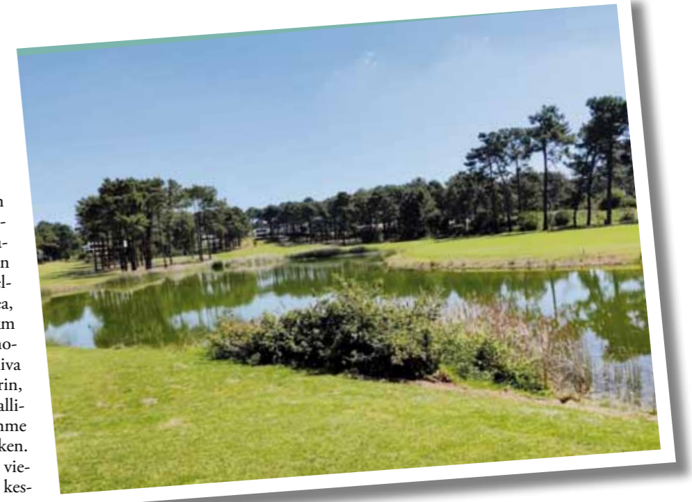
■ Aroeiran kaksi golfkenttää Pines Classic ja Challenge ovat leppoisia, mutta antavat riittävästi myös pelillistä vastusta. Kuvassa Challenge kentän kaunista maisemaa.