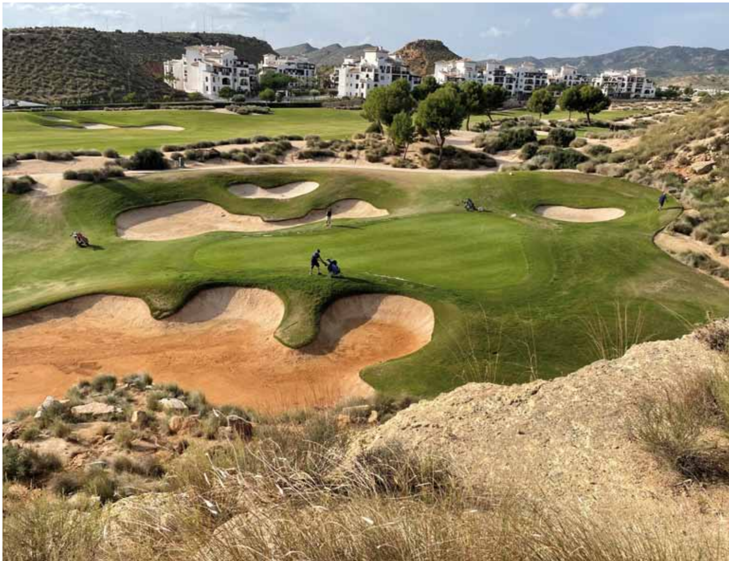
■ Jack Nicklausin toimiston tyypillistä kenttäsuunnittelua edustaa kuvan El Valle.