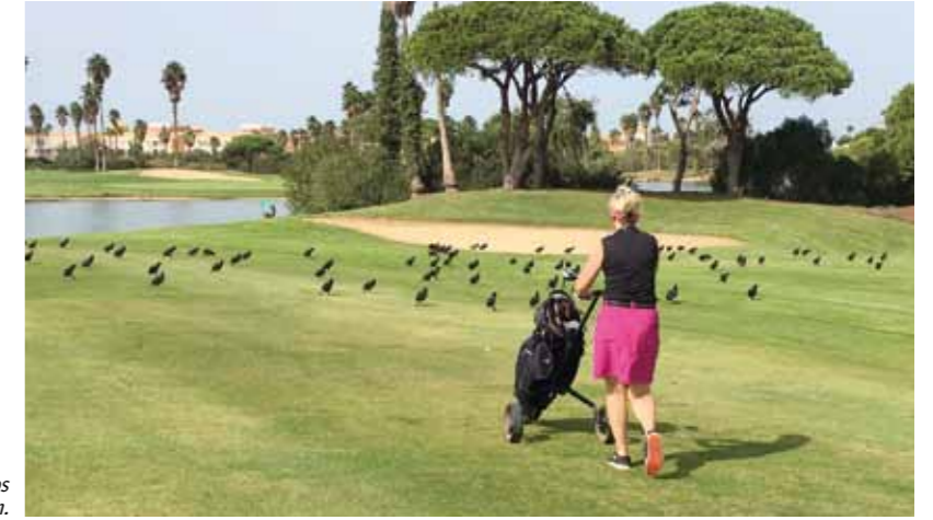
■ Novo Sancti Petri -golfklubin Mar & Pinos kentällä oli birdejä tarjolla enemmänkin.