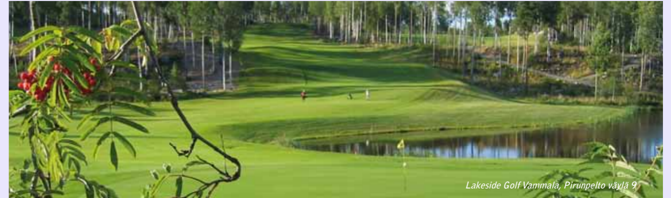
Lakeside Golf Vammala, Pirunpelto väylä 9

ALLA OLEVAT KENTÄT MYÖNTÄVÄT SGS:N JÄSENILLE ALENNUSTA PELIMAKSUSTA