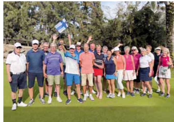
■ Isänpäivän kunniaksi pelattiin Damas vs. Caballeros eli naiset vastaan miehet. Kuten ilmeistä voi päätellä olivat miehet voitokkaimpia.

Viheriöt ovat veikeitä ja vaikeita. Ruoho on erilaista kuin kotikentillämme Suomessa. Se kasvaa aina merelle päin ja auringon suuntaan. Ruoho kallistuu aina merelle päin ja kohti aurinkoa.