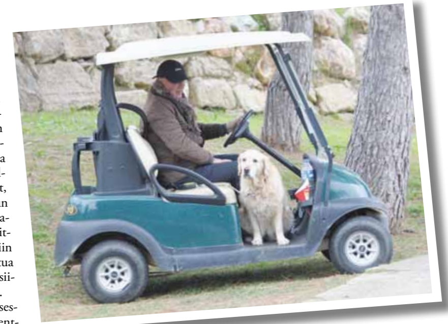
■ Golfin toimitsijatehtävissä Lauro Finnish Open Hosted by Fuge Team 2020 -kilpailussa.

Kirjoitan tätä juttua Alhaurin El Grandessa, Malagassa, jossa meillä on ollut talvikoti nyt neljä vuotta. Espanjaan siirtyminen talvikuukausiksi oli luonteva valinta kaamosmasennuksesta kärsivälle. Talvisia aktiviteettejani ovat golfin lisäksi pyöräily ja kuntosali sekä espanjan kielen opiskelu. Kaupungin kirjastonhoita-