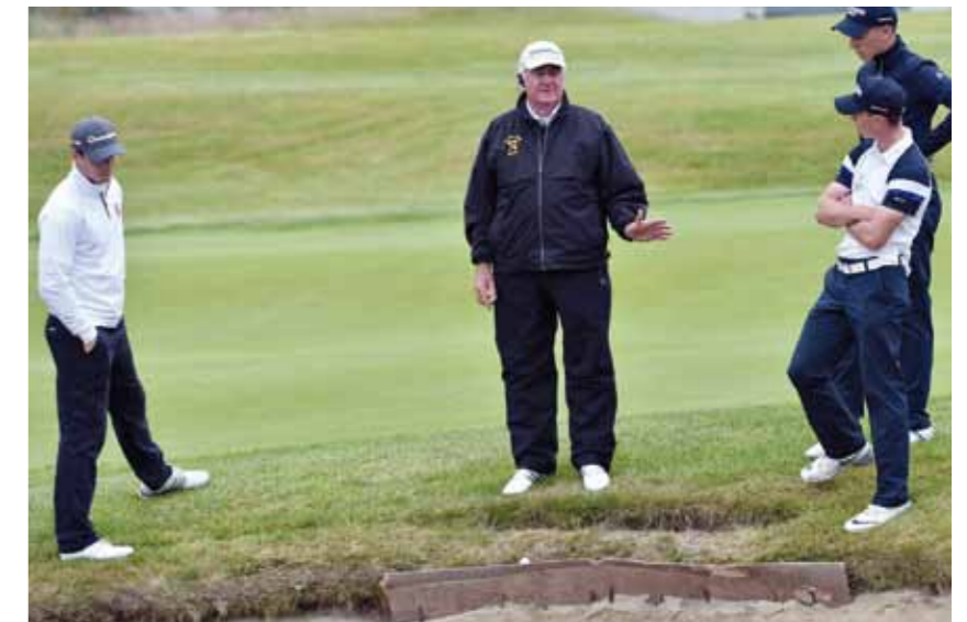
Pelaamaton paikka, vapaa droppi vai ei?

Uusissa säännöissä on kokonaan uusi sääntö 25, jossa on muokkauksia golfsääntöihin koskien toimintarajoitteisia pelaajia. Nämä säännöt ovat voimassa ilman erillistä määräystä. Sääntö 25 sisältää pelaajalle ja hänen avustajalleen sallittuja toimenpiteitä ja lievennyksiä joihinkin sääntörikköisiin (esim. koskemisesta mailalla hiekkaan bunkkerissa ei tule näkövammaisille rangaistusta, punaiselta estealueelta vapautuminen on 4 mailanmittaa jne.)