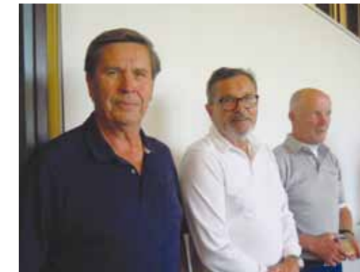
Kuvissa M60 Tourin Order of Merit kummankin sarjan kolme parasta.