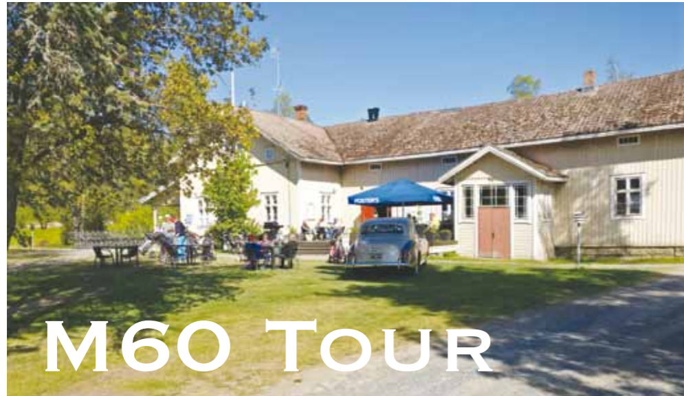
Idyllisessä maalaimaisemassa sijaitsevan Loimijoki Golfin klubitalo, jonka edessä seuran kapteenilla näyttää olevan oma parkkipaikka.

Vuoden 2017 alusta lähtien tulivat miehet Suomessa seniorigolfareiksi 50-vuotiaina. Seuraavaan ikäluokkaan oli entisen kilpailusarjaan mukaan 15 vuotta, mikä on liian pitkä väli mahdollistamaan tasapuolisen kilpailun. Tämän vuoksi päätettiin muodostaa uusi M60 Tour. Täytettyään 60 vuotta on seniorimiehille tarjolla viiden vuoden välein omat sarjansa aina 75-vuotiaisiin asti. Alle 60-vuotiaat miehet pelaavat sarjoissaan ainoastaan tasoituksetonta lyöntipeliä. Todettiin, että tällä uudella tourilla on syytä olla sekä scr- että hcp-sarja M65 Tourin tavoin. Tämän katsottiin madaltavan vanhempien miesten kynnystä osallistua tähän valtakunnalliseen touriin.