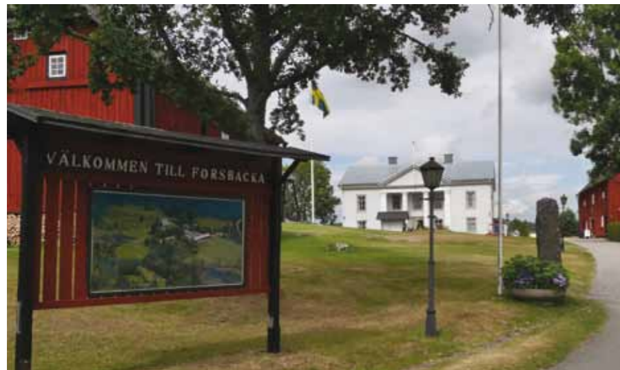
Tyylikäs Forsbackan golfklubi ja -kenttä Ruotsin Ämälissa on syntynyt vanhan kartanon maille.