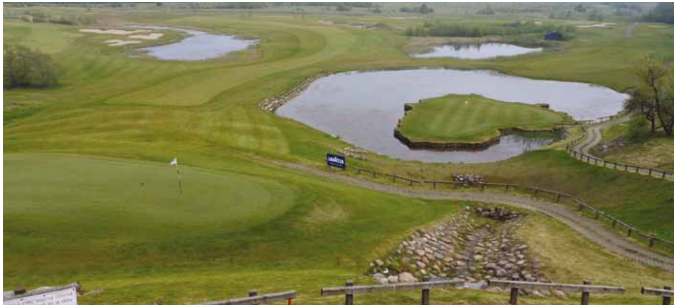
Klaipedan National-kentän 18. viheriö on muotoiltu Liettuan kartan mukaan.

kuulee klubikeskustelujen kielestä. Turun murrekin on edustettuna. Kentällä toivoaankin, että Olkiluodon ydinvoimala ei valmistuisi vähän aikaan. Silloin näet päättyy työvoiman lennätys Gdanskista suorilla halpalennoilla, mutta toisaalta ”finskilä” pääsee nykyään suoraan Helsingistä.