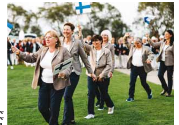
Suomen joukkueen riemua.