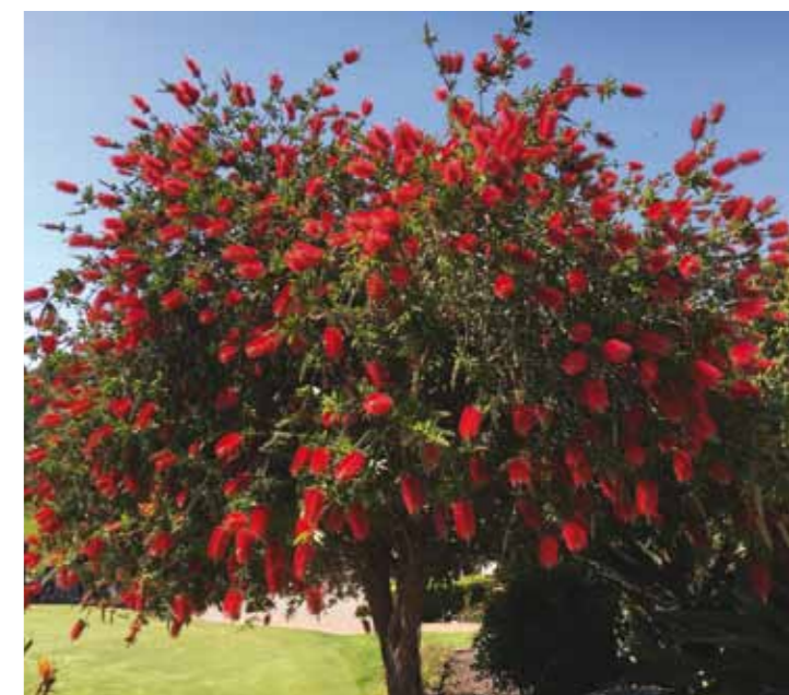
Alakuvassa La Sellan hotelli tunnelmavalaistuksessa.