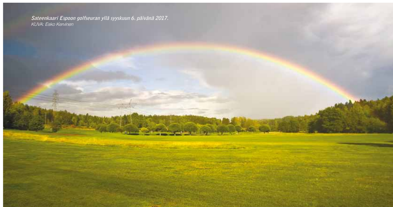
Sateenkaari Espoon golfseuran yllä syyskuun 6. päivänä 2017.