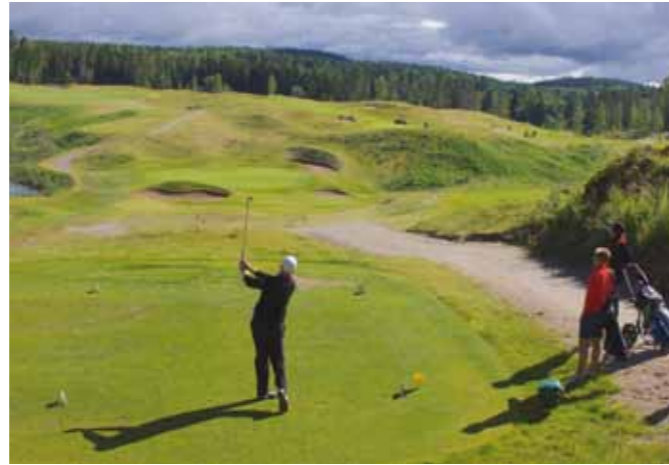
Näkymä Lahden Golf Mestari-kentältä, jossa näyttää muotoja riittävän. Kuvassa noin 150 metriä pitkä kolmosväylä.