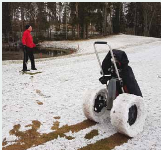
Kuvassa osoitus golfin ”hauskuudesta”. Vaikka olosuhteita ei parhaallakaan tahdolla voi aina kuvailla mukaviksi, jokin ihmeellinen voima vetää meidät kentälle siitä huoli- matta. Kuva todennäköisesti Master Golfista tämä vuoden huhtikuussa. Valitettavasti sekä pelaaja että kuvaaja on jäänyt tuntemattomaksi (toim. huom.).