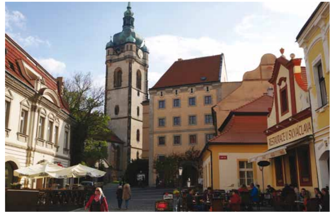
Melnikin kaltaisia satukaupunkeja riittää Tsekissä.

vää, pitävätkö puheet sen alueen hyvästä viinistä paikkansa. Jo vain.